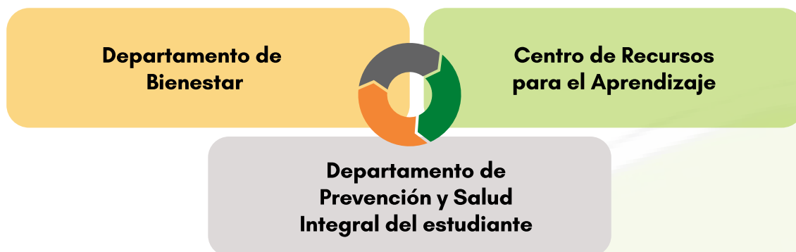
Figura 1. Equipo Multidisciplinario que atienden a la comunidad educativa. (Anexo 3)

Este equipo se encuentra conformado por: